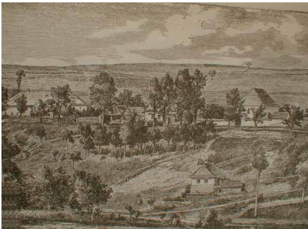
Telecí - statek č. p. 2, reformovaná fara a chrám Páně za hřbitovní zdi . Stav před r. 1881. (obrázek z této brožurky)